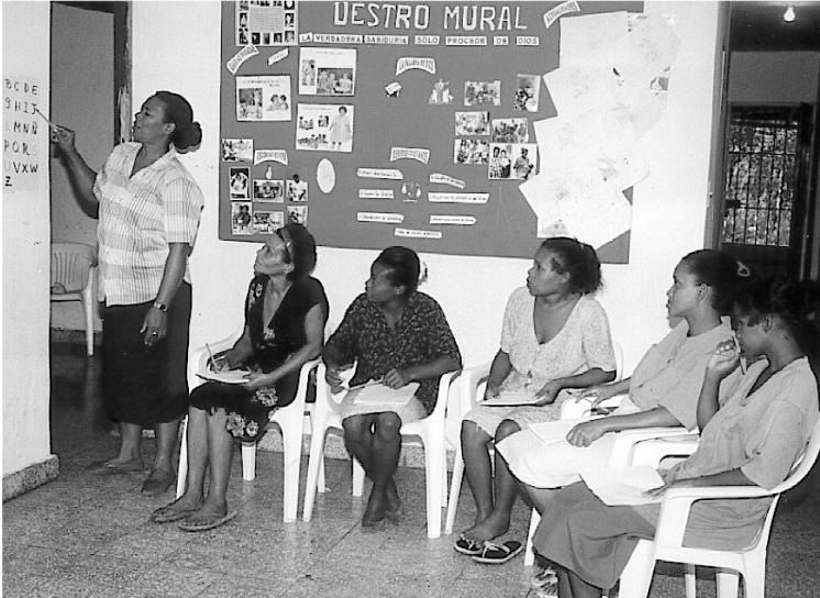
Une classe d'alphabétisation