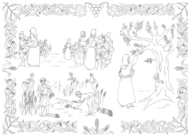
Dessin : Emilie Tavernier

Utilisez le coloriage suivant pour illustrer le texte de Deutéronome 24.19-21 qui montre que Dieu demandait au peuple de laisser une place aux pauvres, aux rejetés, aux malheureux (Pour l'explication du texte, voir la fiche pour les 3-5 ans).