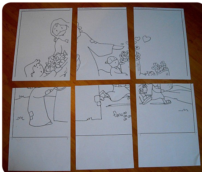
Agrandissement du dessin en 6 feuilles A4