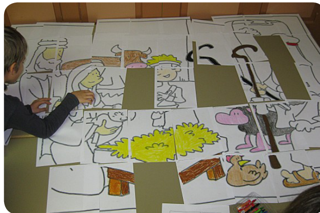
Assemblage d'une fresque pour Noël...