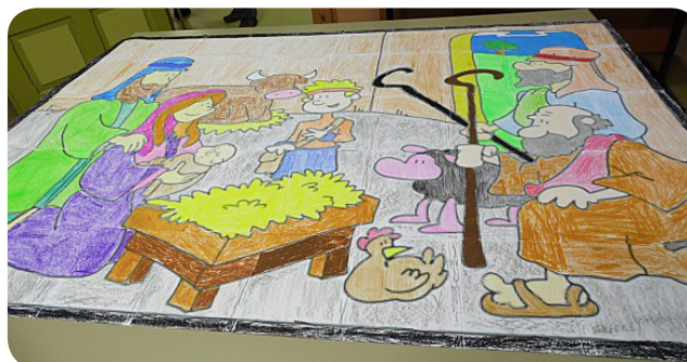
...et la fresque finale !